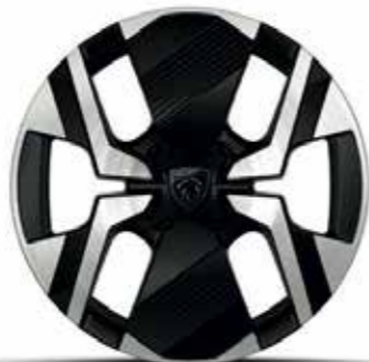
חישוקי סגסוגת KARAKOY ALLURE 17"