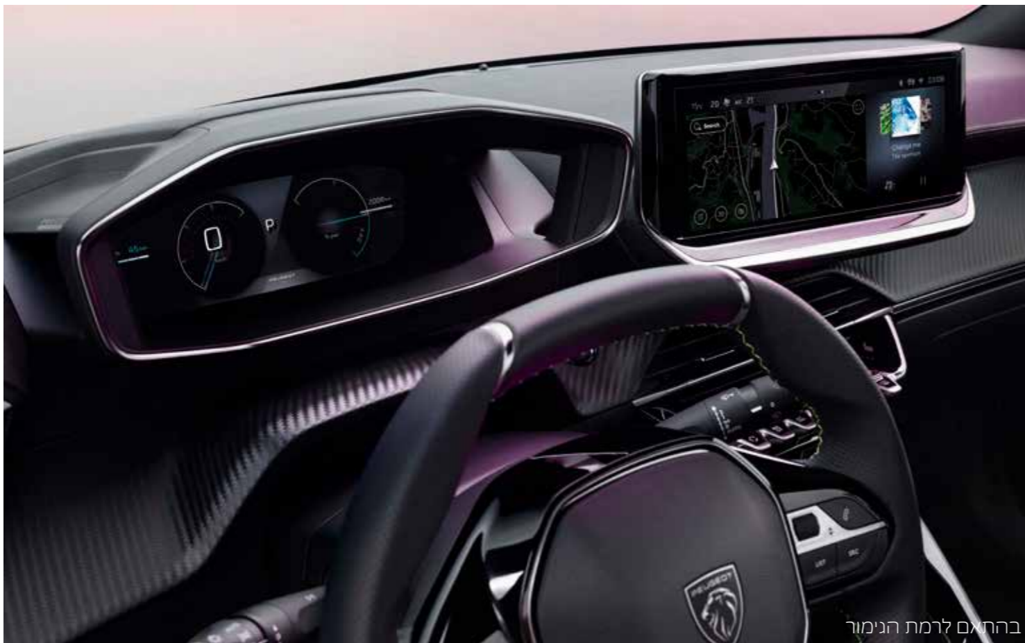
בהתאם לרמת הגימור

הפילוסופיה של PEUGEOT i-COCKPIT® מתמקדת בסביבת נהיגה שמכניסה אתכם לשליטה, מאפשרת חיבור גדול יותר לכביש ומורכבת מהתכונות הבאות: