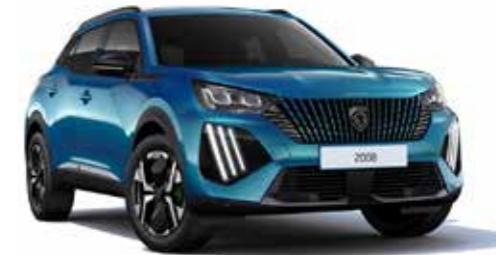
כחול בהיר מטאלי OBSESSION BLUE