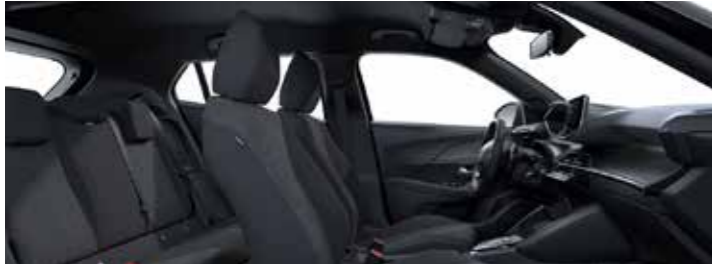
ACTIVE – ריפוד שחור-אפור עם תפר כתום (בהתאם לזמינות המלאי)