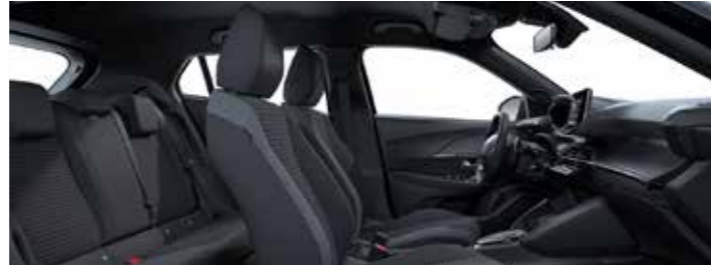
ACTIVE – ריפוד שחור-אפור עם תפר ירוק (בהתאם לזמינות המלאי)