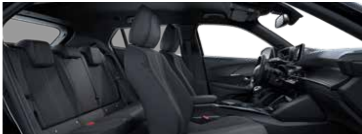
ALLURE – ריפוד משולב בד ועור מלאכותי בצבע אפור-שחור