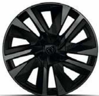
חישוקי סגסוגת EVISSA 18" GT