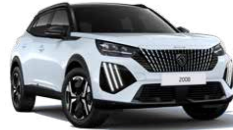
לבן מטאלי OKENITE WHITE (ללא תוספת תשלום ברמת גימור ACTIVE)