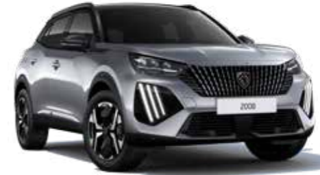
כסוף כהה מטאלי ARTENSE GREY