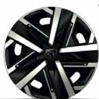
חישוקי סגסוגת SILOM ACTIVE 16"