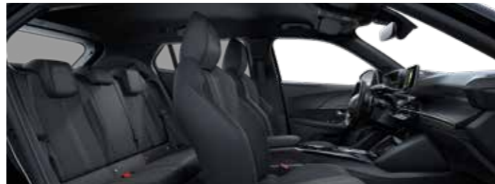
GT – ריפוד משולב בד ועור מלאכותי בצבע שחור