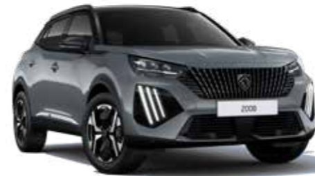
אפור כהה מטאלי SELENIUM GREY (ללא תוספת תשלום ברמות גימור ALLURE ו-GT)