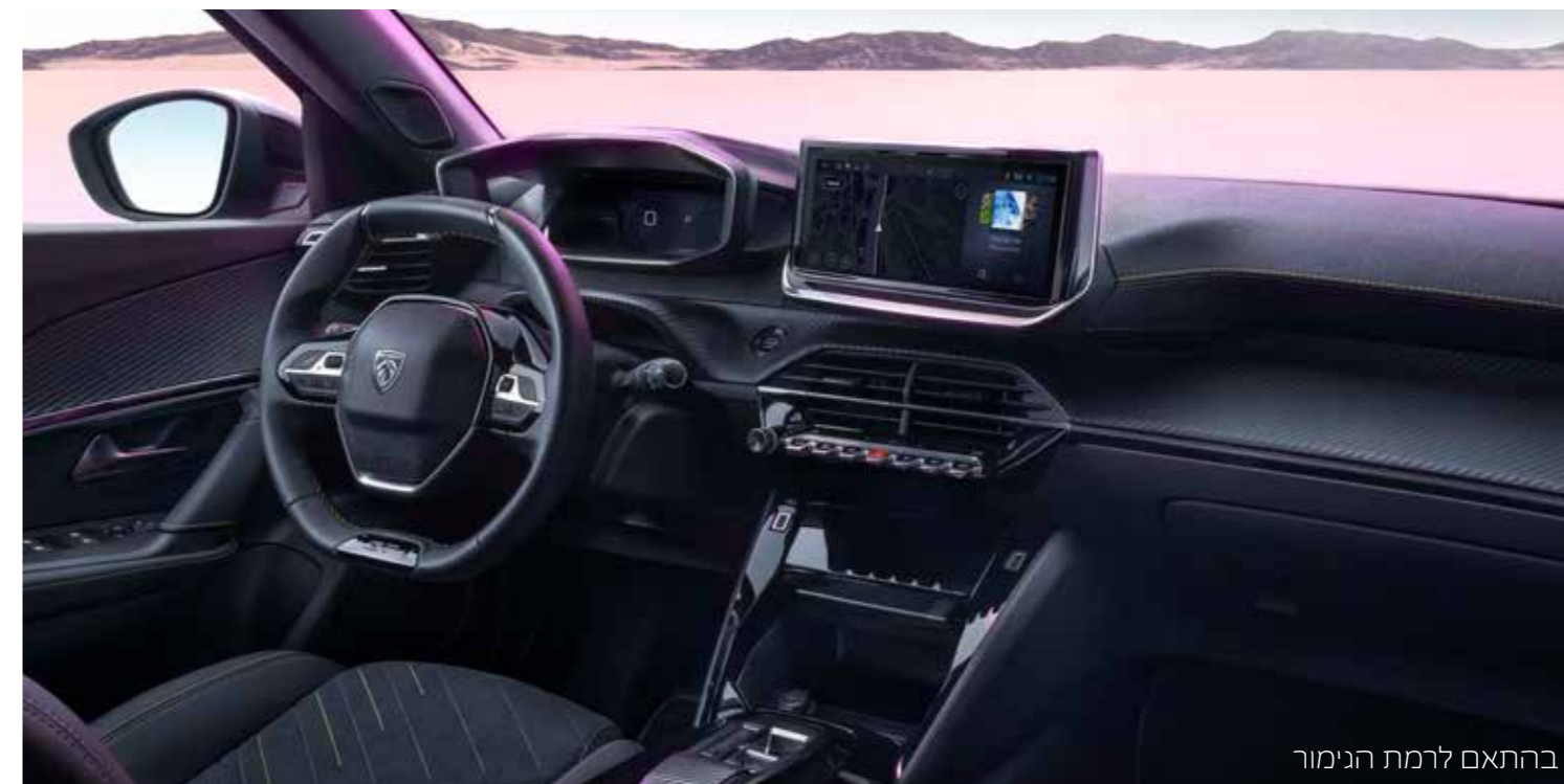
בהתאם לרמת הגימור