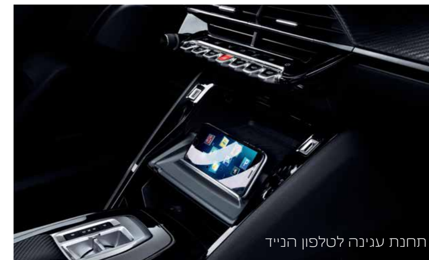
תחנת עגינה לטלפון הנייד

חברו את הטלפון הנייד שלכם בצורה אלחוטית (למכשירים תומכים בלבד), דרך APPLE CARPLAY™ או ANDROID AUTO ותוכלו לשלוט באפליקציות העיקריות שלכם, כגון: טלפון, ניווט, שיחות קוליות והודעות טקסט.