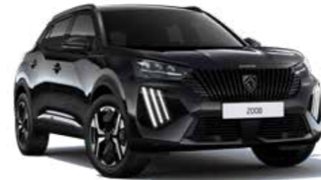
שחור מטאלי NERA BLACK