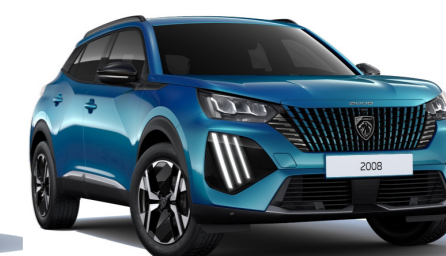
כחול בהיר מטאלי OBSESSION BLUE