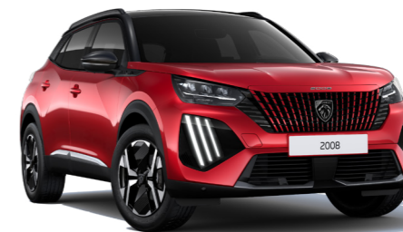
אדום מטאלי ELIXIR RED