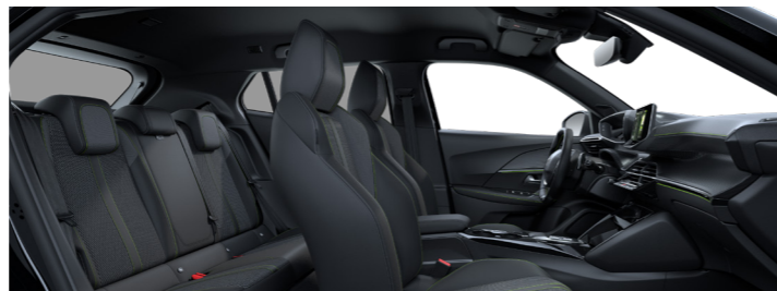
GT – ריפוד משולב בד ועור מלאכותי בצבע שחור