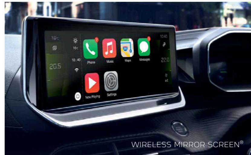
WIRELESS MIRROR SCREEN®