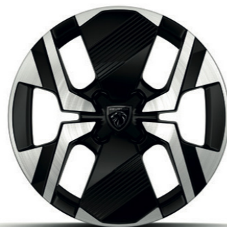
חישוקי סגסוגת KARAKOY ALLURE 17"