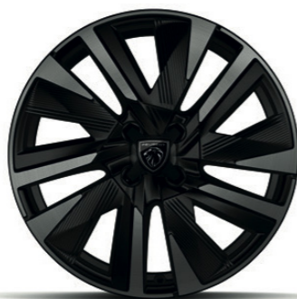
חישוקי סגסוגת EVISSA 18" GT