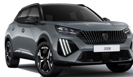
אפור כהה מטאלי SELENIUM GREY (ללא תוספת תשלום ברמות גימור ALLURE ו-GT)