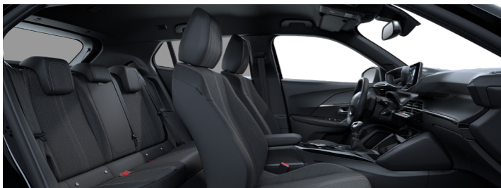
ALLURE – ריפוד משולב בד ועור מלאכותי בצבע אפור-שחור