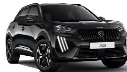
שחור מטאלי NERA BLACK