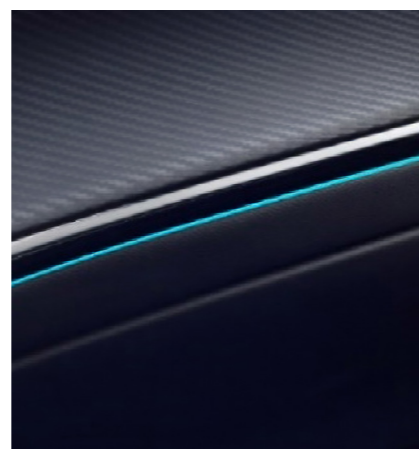
תאורת אווירה הניתנת להתאמה אישית