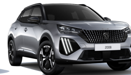
כסוף כהה מטאלי ARTENSE GREY