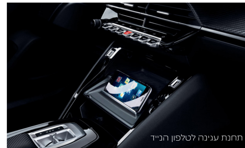
תחנת עגינה לטלפון הנייד

חברו את הטלפון הנייד שלכם בצורה אלחוטית (למכשירים תומכים בלבד), דרך APPLE CARPLAY™ או ANDROID AUTO ותוכלו לשלוט באפליקציות העיקריות שלכם, כגון: טלפון, ניווט, שיחות קוליות והודעות טקסט.