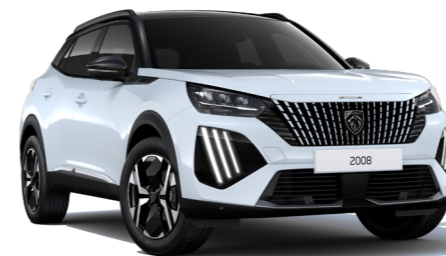
לבן מטאלי OKENITE WHITE (ללא תוספת תשלום ברמת גימור ACTIVE)