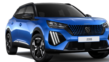
כחול פנינה מטאלי VERTIGO BLUE