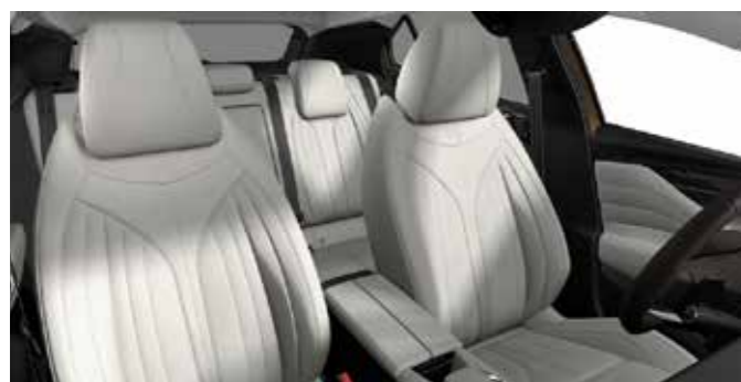
TROCADERO E-TENSE (אופציה) CROSS RIVOLI E-TENSE (אופציה) Pebble Grey Grained Leather