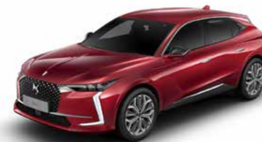
PEPERONCINO RED (M)