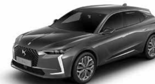
GRIS PLATINUM (M)