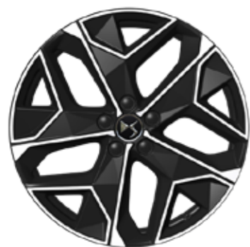
CROSS RIVOLI E-TENSE LIMA 19"