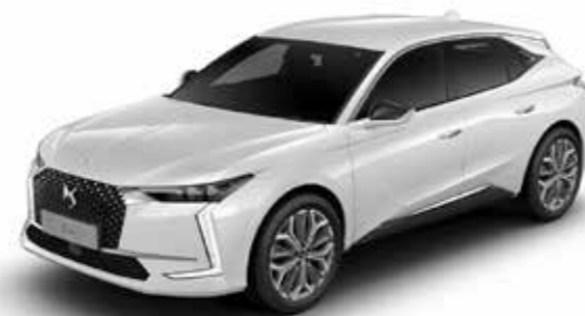
BLANC NACRE (M)