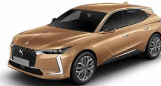
COPPER GOLD (M)