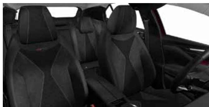
PERFORMANCE LINE Basalt Woven Alcantara