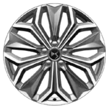
TROCADERO FIRENZE 19"