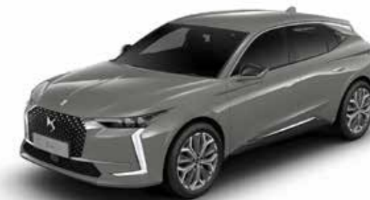
LACQUERED GREY (M)