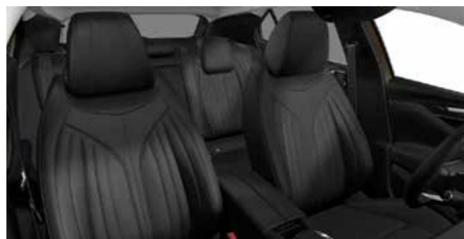
CROSS RIVOLI E-TENSE Basalt Black Grained Leather