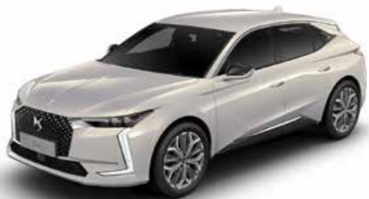
CRYSTAL PEARL (M)