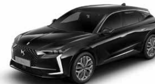
NOIR PERLA NERA (M)