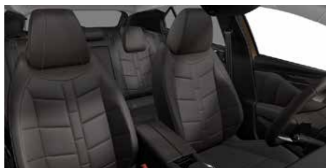
CROSS RIVOLI E-TENSE (אופציה) Criollo Brown Nappa WatchStrap Leather