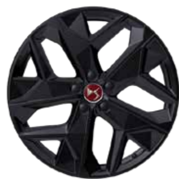
PERFORMANCE LINE MINNEAPOLIS 19"