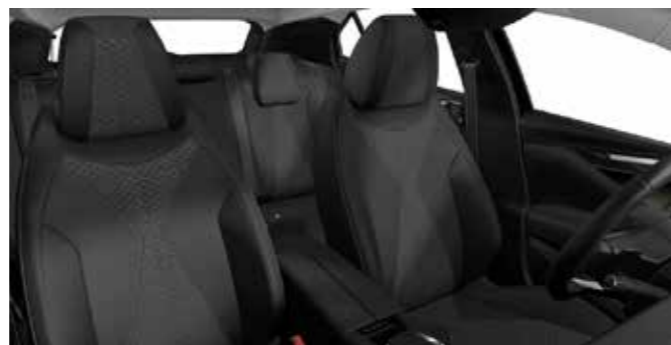
TROCADERO Tungsten Diamond Basalt Vinyl Effect