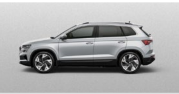
BRILLIANT SILVER (8E)