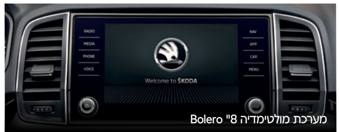
מערכת מולטימדיה 8" Bolero