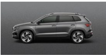
GRAPHITE GREY (5X)