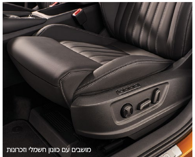
מושבים עם כוונן חשמלי וזכרונות