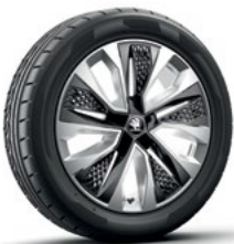
חישוקי סנסונגת PROCYON 18"