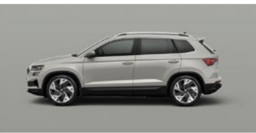
STEEL GREY (M3)