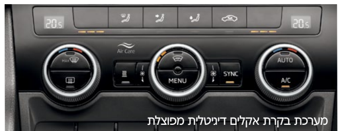
מערכת בקרת אקלים דיגיטלית מפוצלת