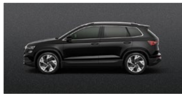
MAGIC BLACK (1Z)