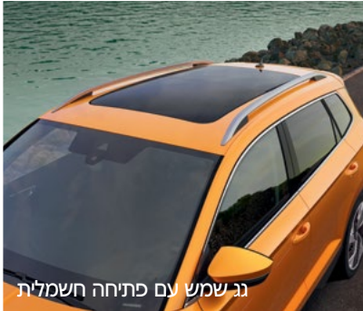
נג שמש עם פתיחה חשמלית