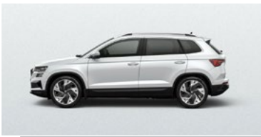
MOON WHITE (2Y)