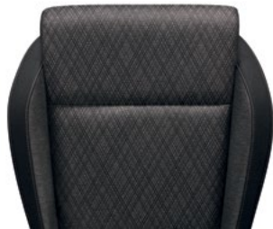
ריפודי בד - שחור