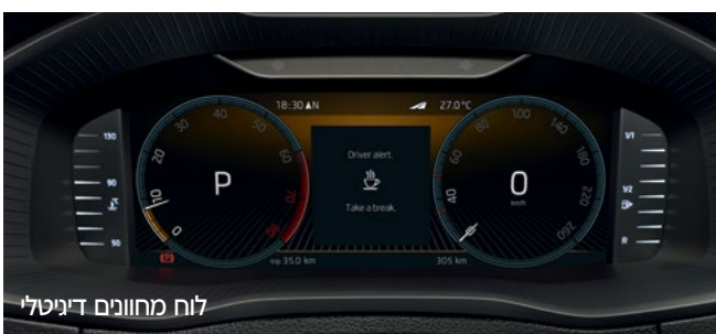
לוח מחוונים דיגיטלי