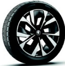
חישוקי סנסונגת MIRAN 18"