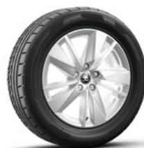
חישוקי סנסוג SCUDUS 17"