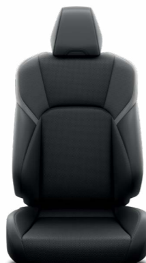
עור שחור ריפוד עור בצבע שחור, מגיע ברמת גימור XLE צבע חיצוני לבן צחור וכסוף מטאלי