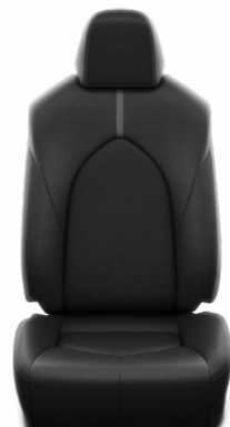
עור מלאכותי שחור מגיע ברמת גימור LE