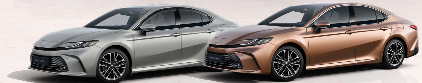
כסוף יוקרתי 1F7