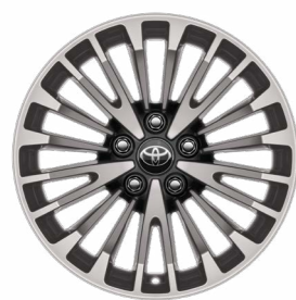
חישוקי סגסוגת קלה 17" ברמת גימור LE