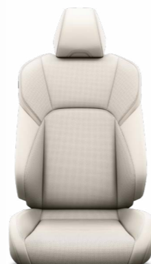
עור בהיר ריפוד עור בצבע בז', מגיע ברמת גימור XLE