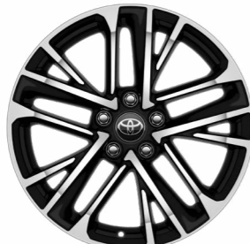
חישוקי סגסוגת קלה 18" ברמת גימור XLE