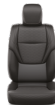
ריפוד עור בצבע שחור זמין ברמת גימור SAHARA SKY MHEV (כתלות בצבע חיצוני)