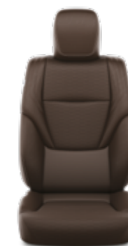
ריפוד עור בצבע אדמה זמין ברמות גימור SAHARA SKY MHEV (כתלות בצבע חיצוני)