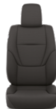
ריפוד בד בצבע שחור זמין ברמת גימור SELECT MHEV