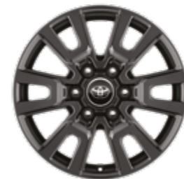
חישוקי סגסוגת קלה 18" זמין ברמת גימור LUXURY MHEV