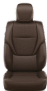
ריפוד עור מלאכותי בצבע אדמה זמין ברמת גימור LIMITED SKY MHEV