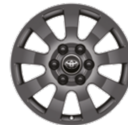
חישוקי סגסוגת קלה 18" זמין ברמת גימור LIMITED SKY MHEV