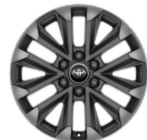
חישוקי סגסוגת קלה 20" זמין ברמת גימור SAHARA SKY MHEV