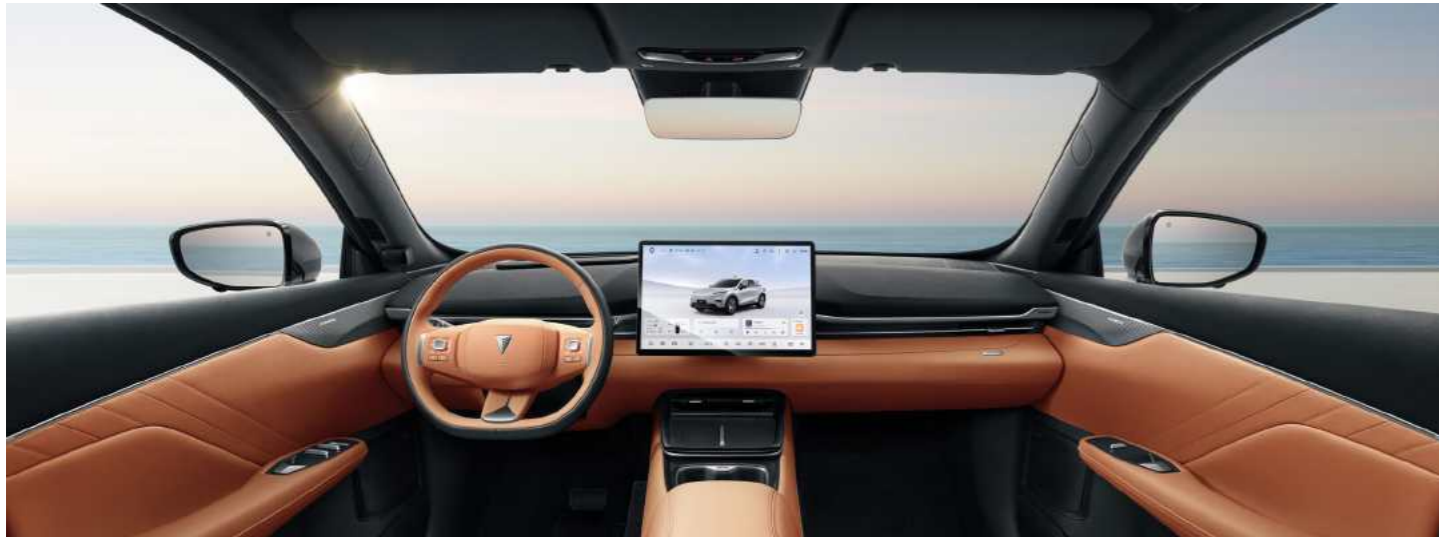
קוקפיט חכם עם מסך מסתובב 15.4" וחיווי קולי

ב-DEEPAL SO5 חויית הנסיעה הופכת לחכמה ומתקדמת מתמיד עם מסך מגע מסתובב בגודל 15.4 אינץ' עם ממשק קולי חכם, מערכת שמע עוצמתית עם 14 רמקולים איכותיים ותצוגת מציאות רבודה (AR-HUD) שמקרינה את המידע ישירות לשמשה הקדמית. כל זה מאפשר לך להישאר מרוכז בנהיגה וליהנות מחויית נסיעה חדשנית, שבה הטכנולוגיה משתלבת בהרמוניה עם הנהג והנוסעים ליצירת קונספט חדש של רכב חכם.