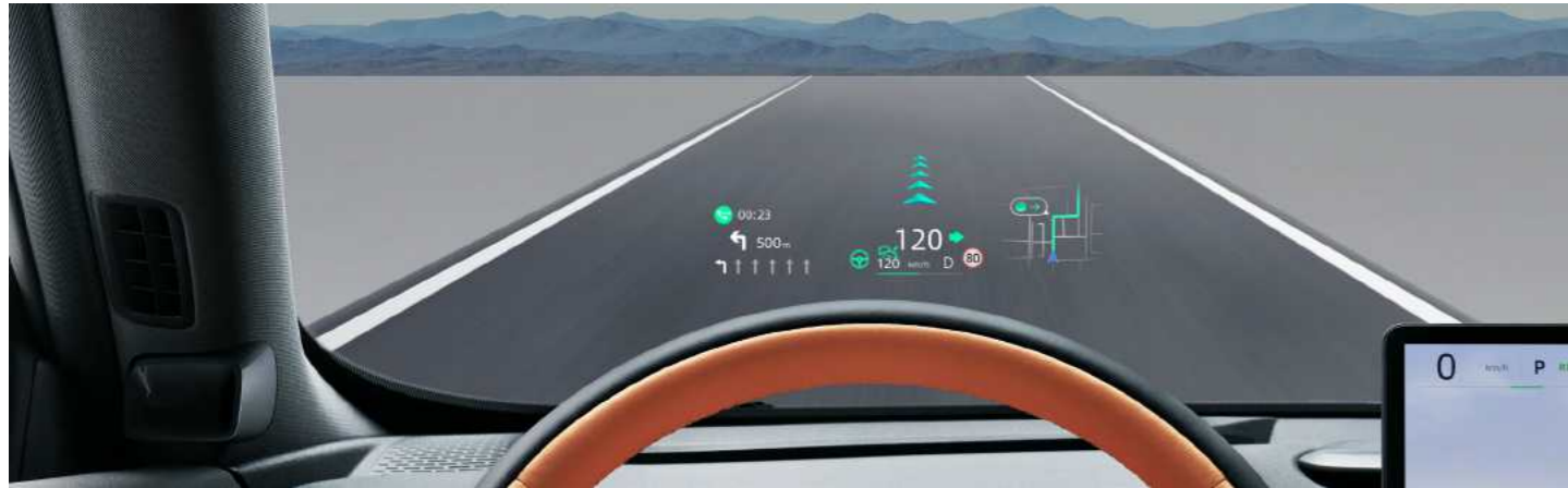
מערכת תצוגה עילית (AR-HUD)