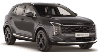
אפור מט (MGG)