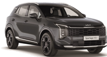
אפור כהה (KDG)