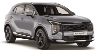
אפור בהיר (KLG)