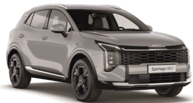
אפור בטון (C7A)