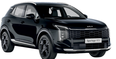
Black Pearl (1K)