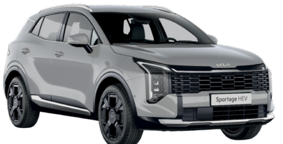
Wolf Gray (WAF)