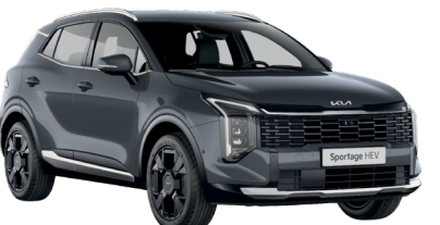
Dark Gray (H8G)