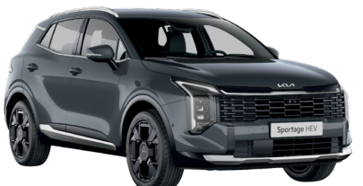
Gark Gray (H8G)